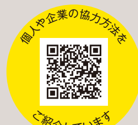
個人や企業の協力方法を ご紹介しています