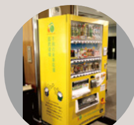
寄付型自動販売機