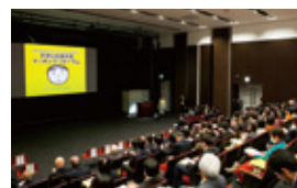
2018年度までに全国15ヶ所で開催