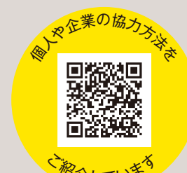
個人や企業の協力方法を ご紹介しています