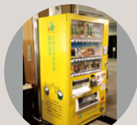
寄付型自動販売機