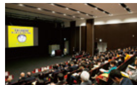
2018年度までに全国15ヶ所で開催